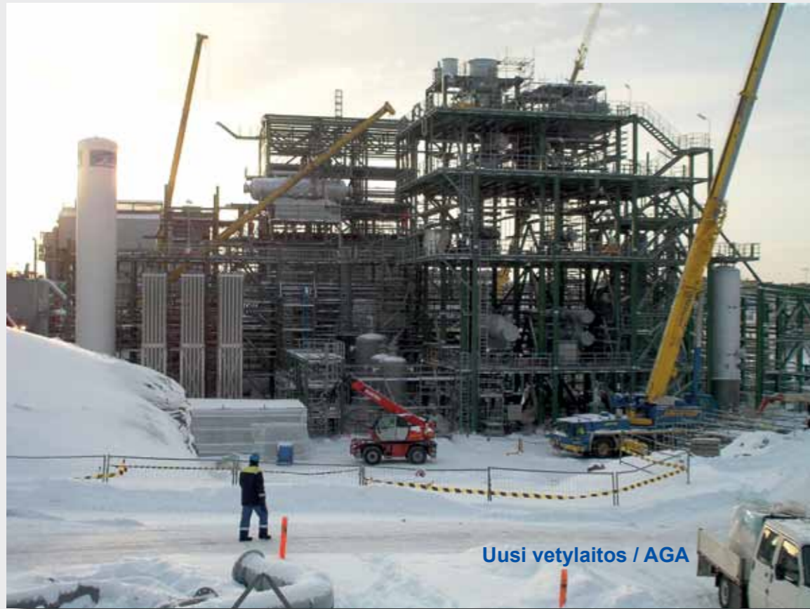
Uusi vetylaitos