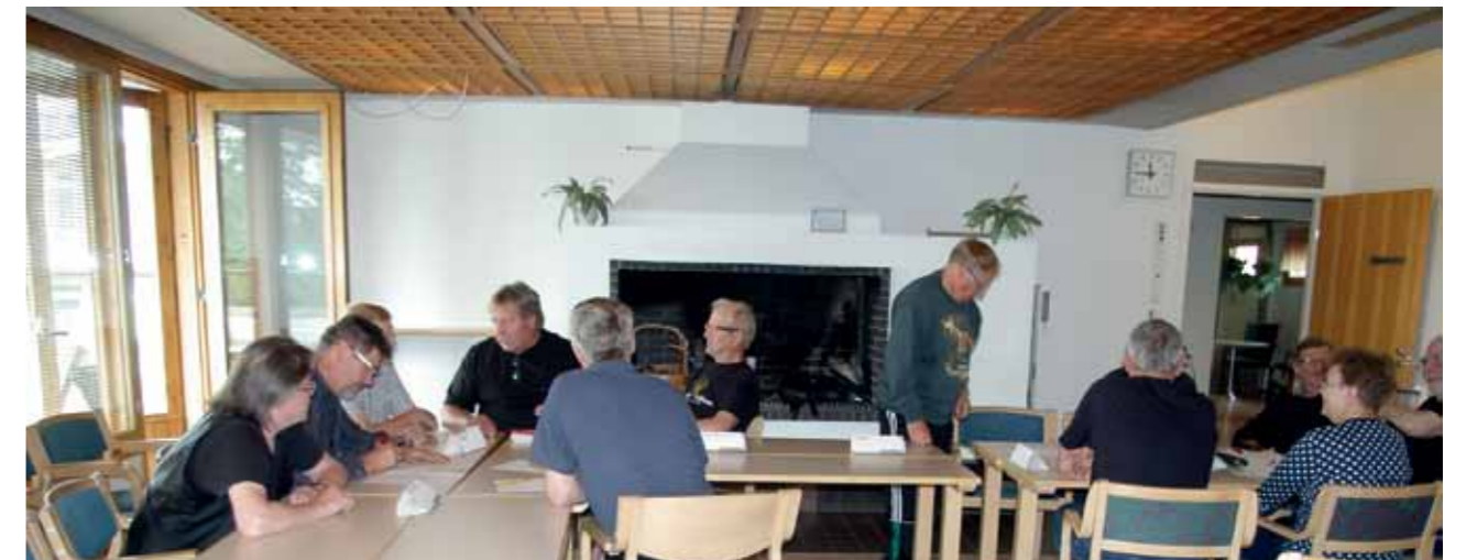
Juttuja riitti vanhoilla tovereilla.