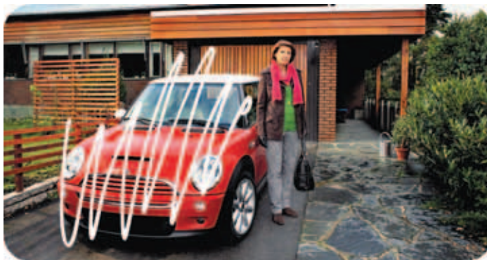
Nordea Pankki Suomi Oy

Metalliliiton kohtalo päätetään liittokokouksessa Tampereella 25.-28.5.2008. Liittokokousedustajat valitaan demokraattisilla Metalliliiton vaaleilla, joten jäsenistön äänestyksen tulos ratkaisee liiton itsenäisyyden kohtalon.