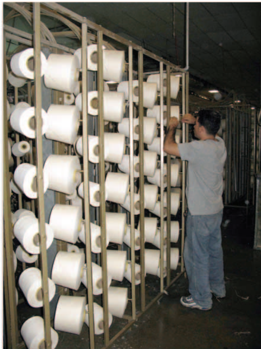
Groupa M:n farkkutehdas Dominikaanisessa tasavallassa valmistaa farkkuja mm. Levik- selle ja GAPille.

Perusoikeuksien kunnioitta- minen edellyttää jatkuvaa valp- pautta. Amnesty International voi auttaa myös ammattiyhdis- tysliikettä ja yksilöitä pitämällä esillä työntekijöiden perusoikeu- det. Amnesty Internationalin ko- tisivulta www.amnesty.fi löytää lisää tietoa Amnestyn toiminnas- ta ja siitä, miten järjestöön voi liittyä. Kansainvälisen työjärjes- tön ILO:n kotisivut ovat osoit- teessa www.ilo.org ja suomek- sikin löytyy www.mol.fi ja haul- la ILO. ■