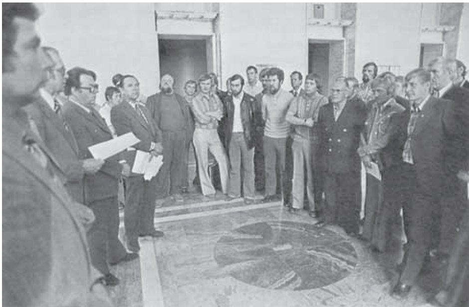
Komennustyömaiden luottamusmiehiä eduskunnassa 20.5.1976 vaatimassa verotuspää- töksen kumoamista.

tuksesta ja kyseisestä kokouksesta, sain hilpeitä vastauksia, että hauskaa oli ja ilmaista kaljaa riitti. Kun kaikki osaston jäsenet eivät halunneet olla demareita, syntyi demareille poliittinen vastavoima, nykyinen "Metallin vaikuttajat", sitoutumattomat vasemmistoliittoa lähellä olevat jäsenet.